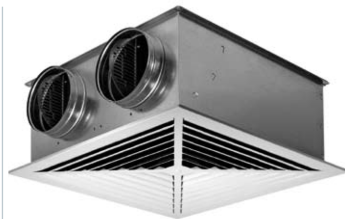
Bild 2: Lineardurchlass LFQ mit Kasten K2 für hohe Volumenströme und geringe Einbauhöhen