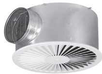
DTR0 met plenumbox R1