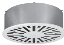
DVR0 met plenumbox R3