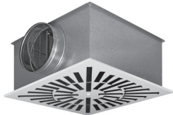
DXQ1 met plenumbox K1