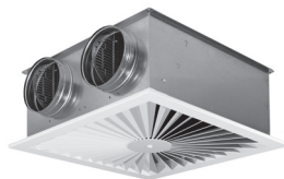
DSQ met plenumbox K2