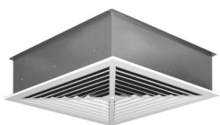
LFQ met plenumbox K3