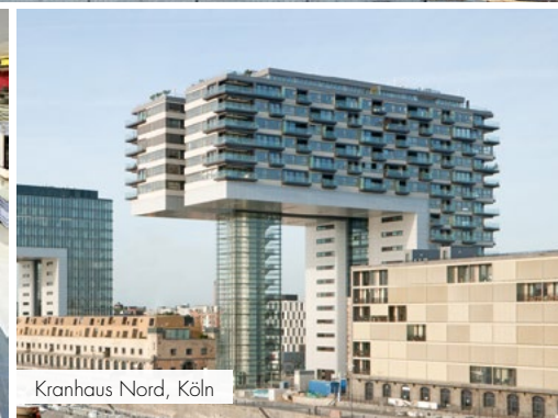
Krankenhaus Nord, Köln