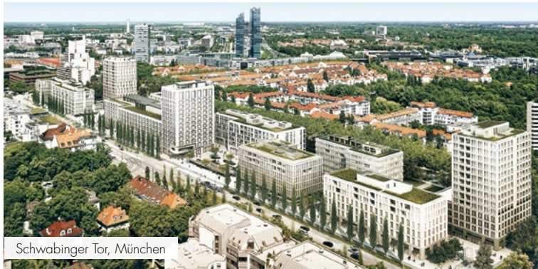
Schwabinger Tor, München